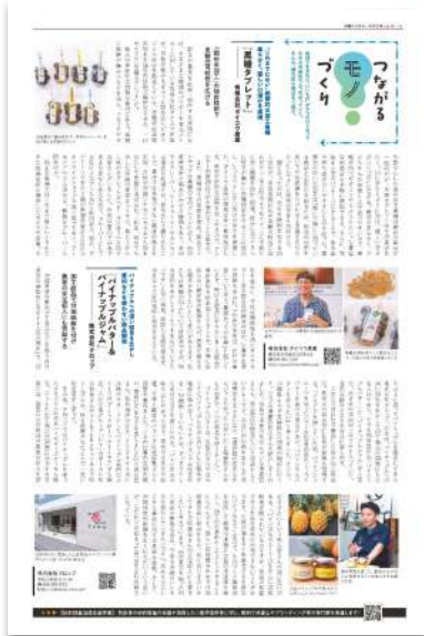
●P4 つながるモノづくり●