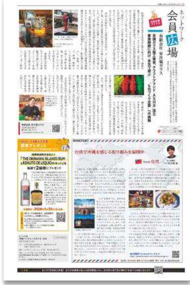
●P8 会員広場、海外レポート、プレゼント企画●