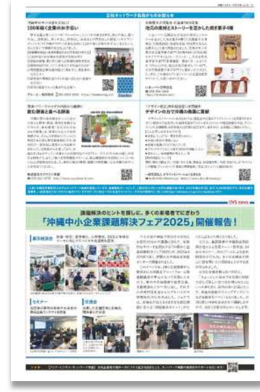
●P6 会員プレスリリース、OVSnews●