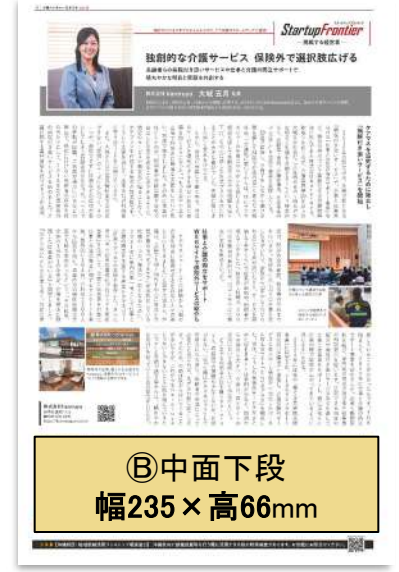
●P5 スタートアップフロンティア●