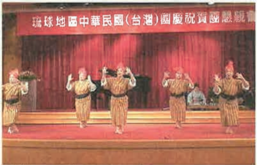
懇親会では、琉球舞踊を披露し、交流を深めました

いきたいという希望、また台湾との交流を深めていくためにも、酒税・関税の引き下げを要請したい意向を伝えました。