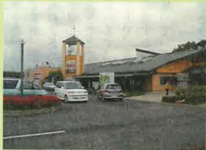
茨城県「ポケットファームどきどき」の外観

の大切さを、今回のイベントにも反映させていきたいですね。最近30・40代の農家も増えているので、そういう方々がまともに勝山の良さをたくさんの人たちに堪能してもらいたいです。シークワサーの花は、本当に香しいんです」 シークワサーの香りを勝山の山に登って楽しみ、帰りに山羊汁で温まる……。これまで知らなかった勝山の魅力が、これからどんどん広まっていきそうです。 ※平成18年度のグローバル・ベンチャースピリット人材育成事業では、東京、新潟、中国、台湾、フランスなどに12人の研修生を派遣しております。公社では、平成19年度も当事業を継続していく予定。お問い合わせは、(財)沖縄県産業振興公社産業振興課まで。 ☎098(859)6239 E-mail: info@okinawa-ric.or.jp