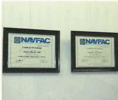
海軍の認証する安全管理責任者(NAVFAC)の証書。この資格を有するスタッフが2人いるので、今後NAVFACを得るためのセミナーなども行いたいという

たい。空港利用の仕方、バスの乗り方など沖縄に入ってくる外国人がスムーズに会場まで来ることができるようになるのがコンベンション・オーガナイザーだと思っています。旅慣れていない人にとっても、言葉の通じない怖いところに行くイメージを払拭するぐらいのレベルアップしたソフト面の強化を目指しています。