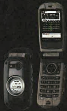
ビジネスケータイ CDMA 1X WIN E03CA by CASIO