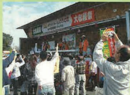
じゃんけんで勝つと、生産者の野菜がもらえるゲームで大盛り上がり(収穫祭にて)

それと同時に、勝山にも地域外からのお客様に楽しんでもらえる魅力がたくさんあることを再確認したといえます。 「シークワサーはもちろんです。それをたくさん使った料理を出すレストランや、そのレシピの提供などいずれはやりたいですね。また、トレッキングで登れる山の魅力を県内外の人にもっと知ってもらいたい。それに、勝山は山羊汁の里でもあるんです。地域には『羊魂碑』という山羊の魂を祀る碑もあり、かつては県内各地から600人も集い慰霊祭が行われていたんです。そのような歴史ある山羊料理の里としても今後はもともととアピールしていきたい」 目下の目標は、3月17・18日に行われる「勝山シークワサー花祭り」を大成功させることだといえます。 「研修先で感じた生産農家のチームワーク