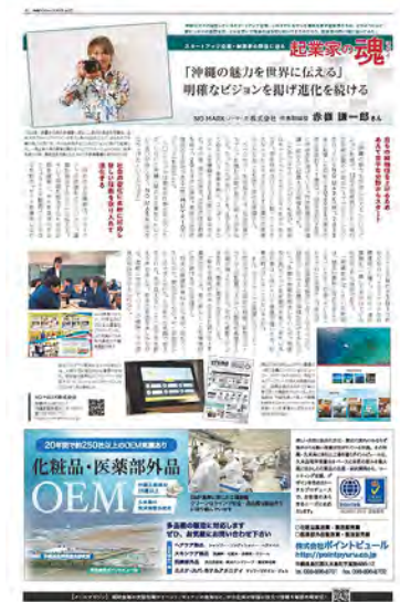
●P5 起業家の魂(人紹介)