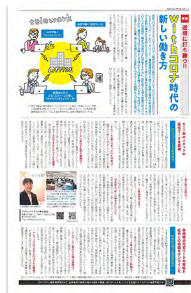
●P6 会員プレスリリース