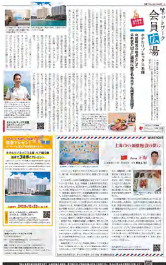
●P8 会員広場、海外レポート、プレゼント企画