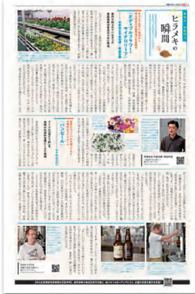
●P4 ヒラメキの瞬間(モノ紹介)