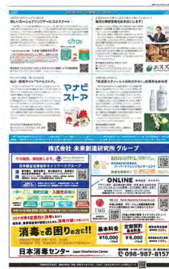
●P6 会員プレスリリース