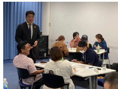
昨年度の 集合研修の様子