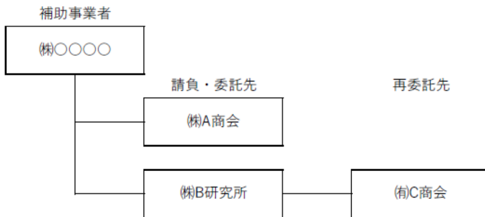
実施体制図（税込み100万円以上の請負・委託契約）