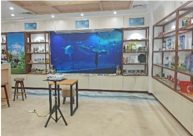
1階 沖縄物産観光展示コーナー