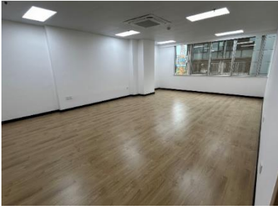
4階 募集部屋401-1 (37.7㎡)