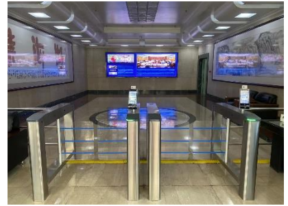
2階 エントランスホール入口