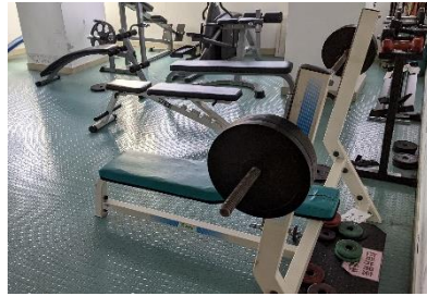
7階 トレーニングルーム