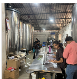
南島酒販株式会社