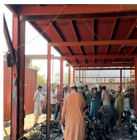
合同会社 O's Company