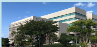
沖縄産業支援センター